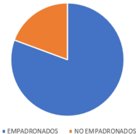
PRESUPUESTOS PARTICIPATIVOS 2025