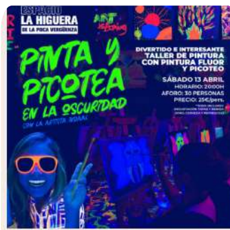
Taller Pinta y Picotea Sab. 13 Abril 2024